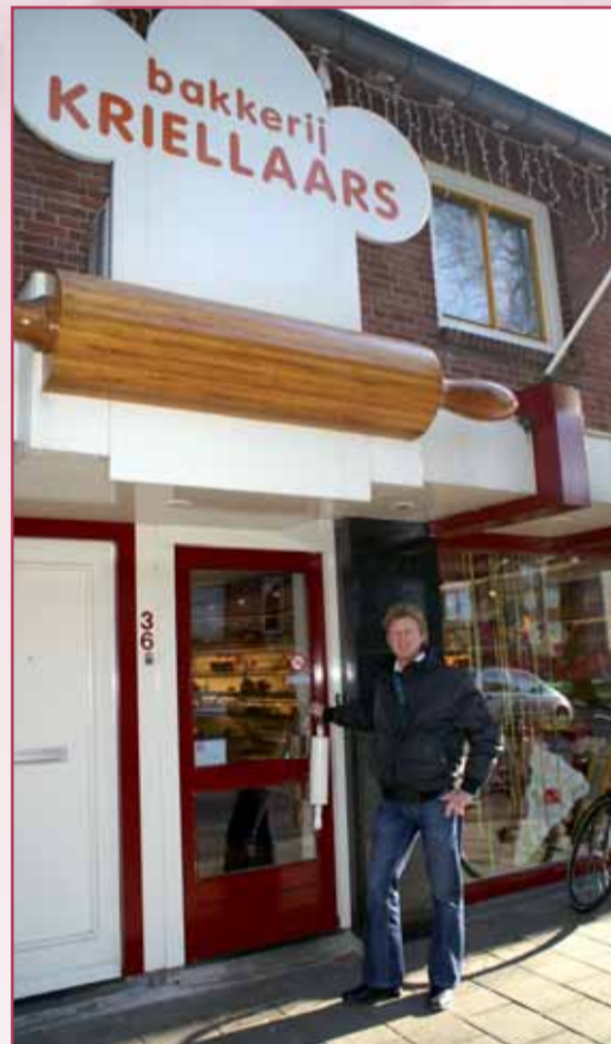
Een overval zorgt niet alleen voor materiële, maar ook voor emotionele schade

Een golf aan overvallen is heel vervelend, maar je kunt er ook van leren. Welke patronen worden gevolgd, welke doelen staan voor ogen, wat trekt aan, wat schrikt af, enzovoort. Omdat overvallers vaak onevenwichtig te-